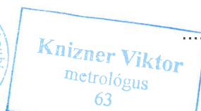
Knizner Viktor metrológus